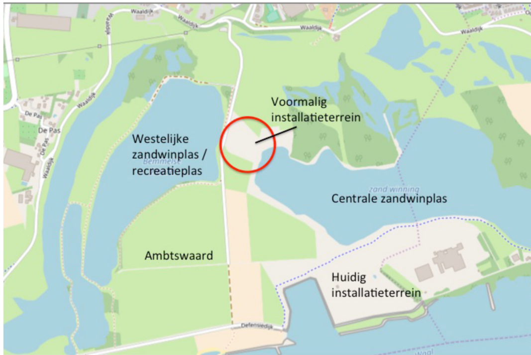
Figuur 1 Ligging voormalige installatieterrein (rood omcirkeld) in de Bemmelse Waard