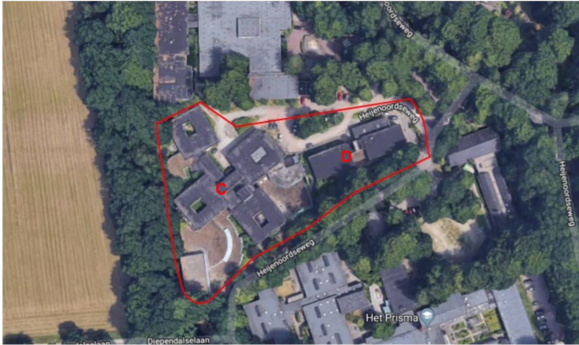
Figuur 1. Heijenoordseweg 7 te Arnhem (rood omlijnd). De verblijfplaatsen van vleermuizen zijn aangetroffen in gebouw D.