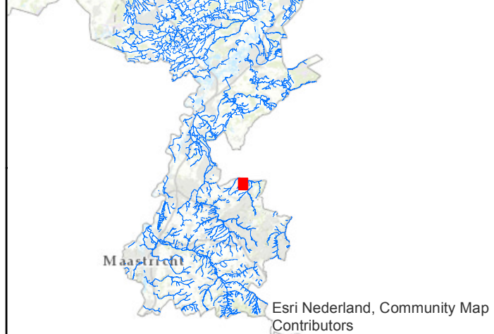
Overzichtskaartje (schaal 1:1.000.000)