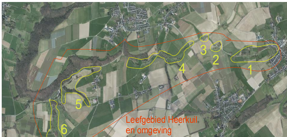
Figuur 2: nieuw historisch leefgebied in Zuid-Limburg