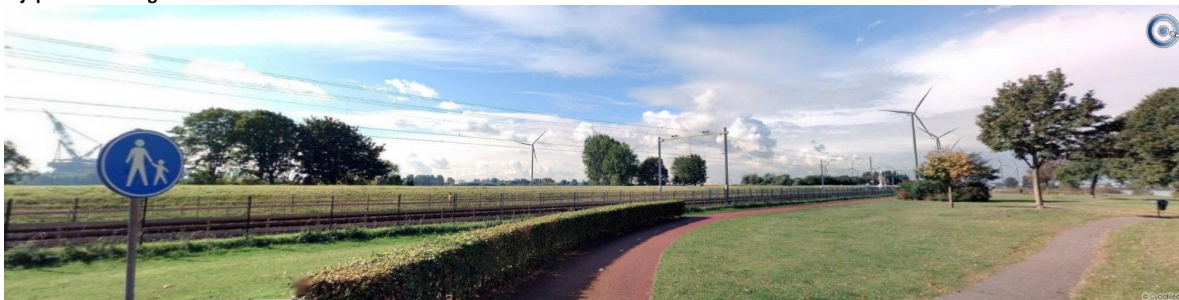
Kijkpunt C ondergrens