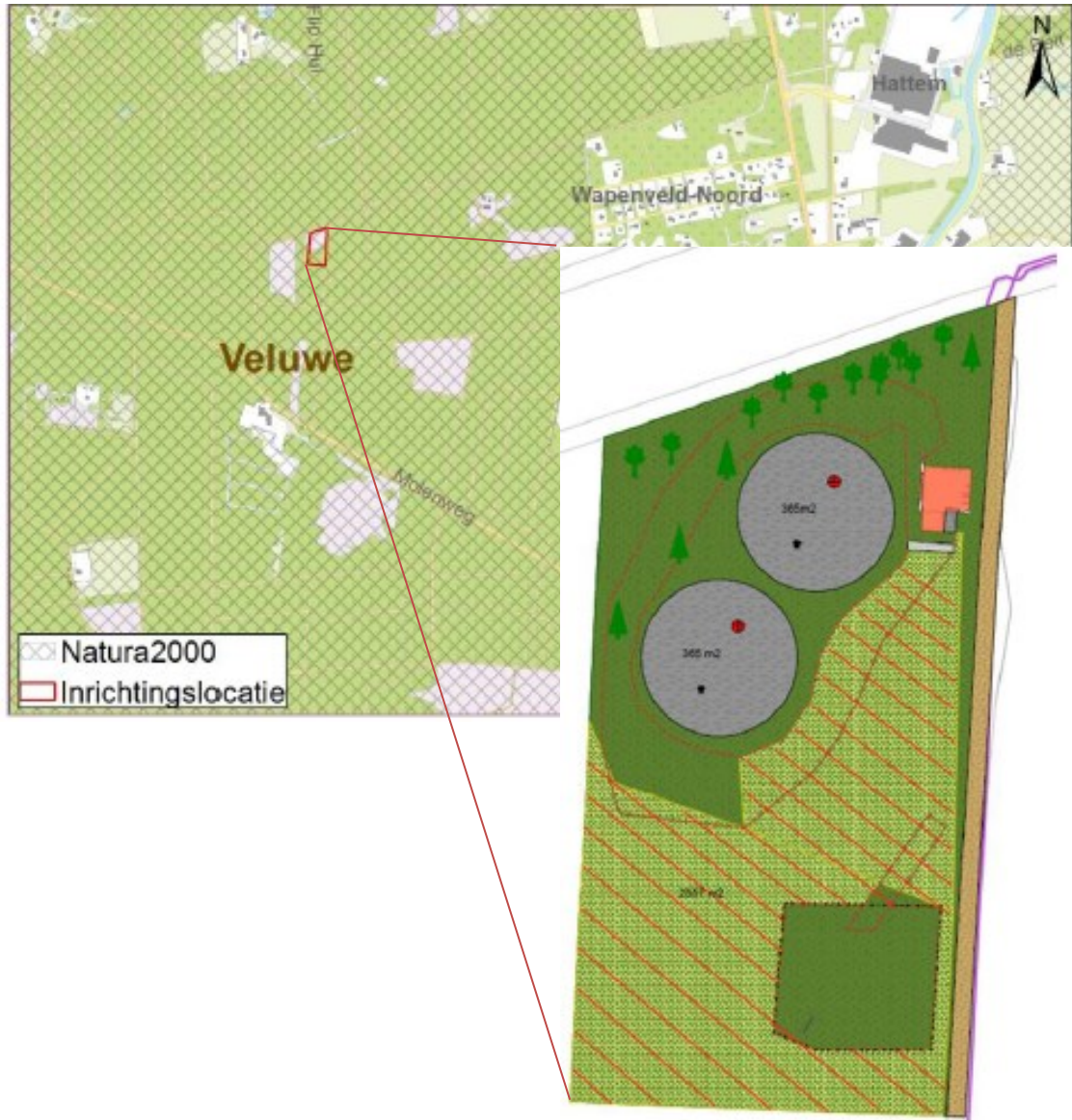
Figuur 1 Ligging projectgebied (rood omkaderd) en begrenzing projectgebied (ingezoomd)