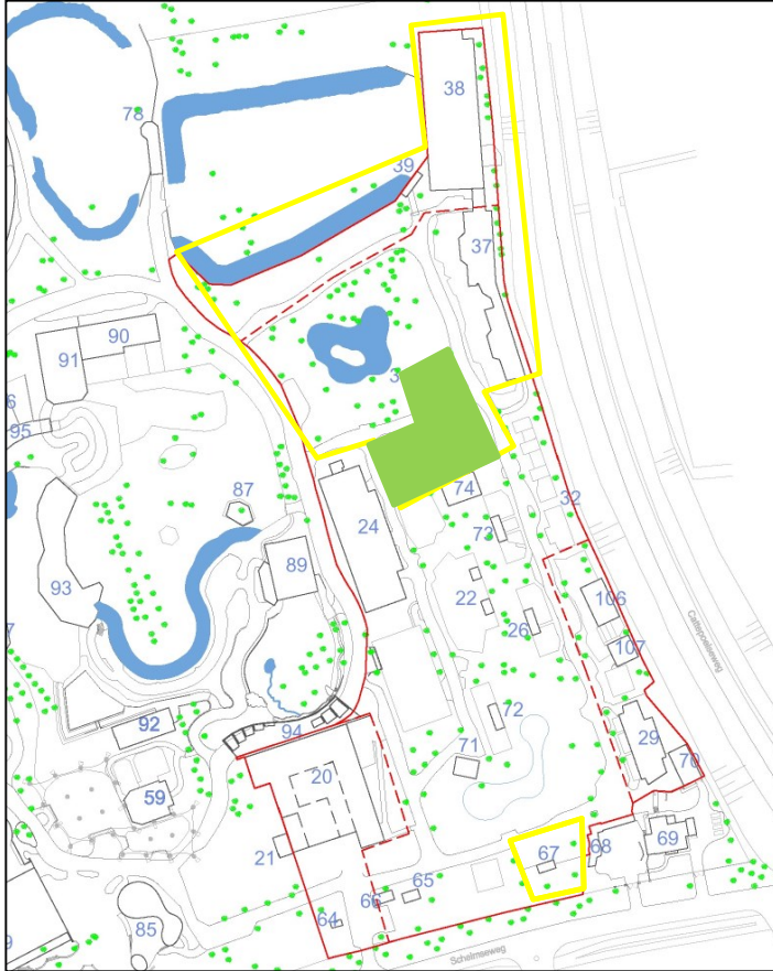
Figuur 2 Plangebied (groene marking)(rood is oorspronkelijk plangebied, geel betreft fase 2)