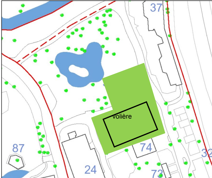
Figuur 3 Verblijven in het groene deel (gebouw 33, 34 en de volière voor de gieren (De Vrije Vlucht) waarop deze ontheffingsvraag betrekking heeft