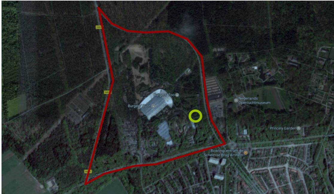
Figuur 1 Luchtfoto met locatie plangebied (groene cirkel)