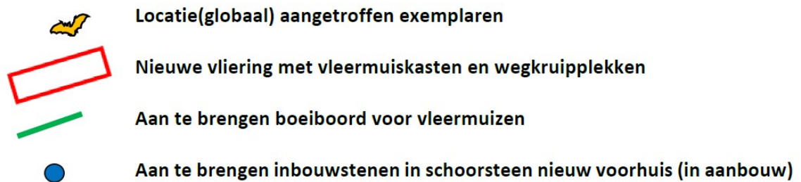
Figuur 2 Locaties van de permanente voorzieningen voor de gewone grootoorvleermuis.