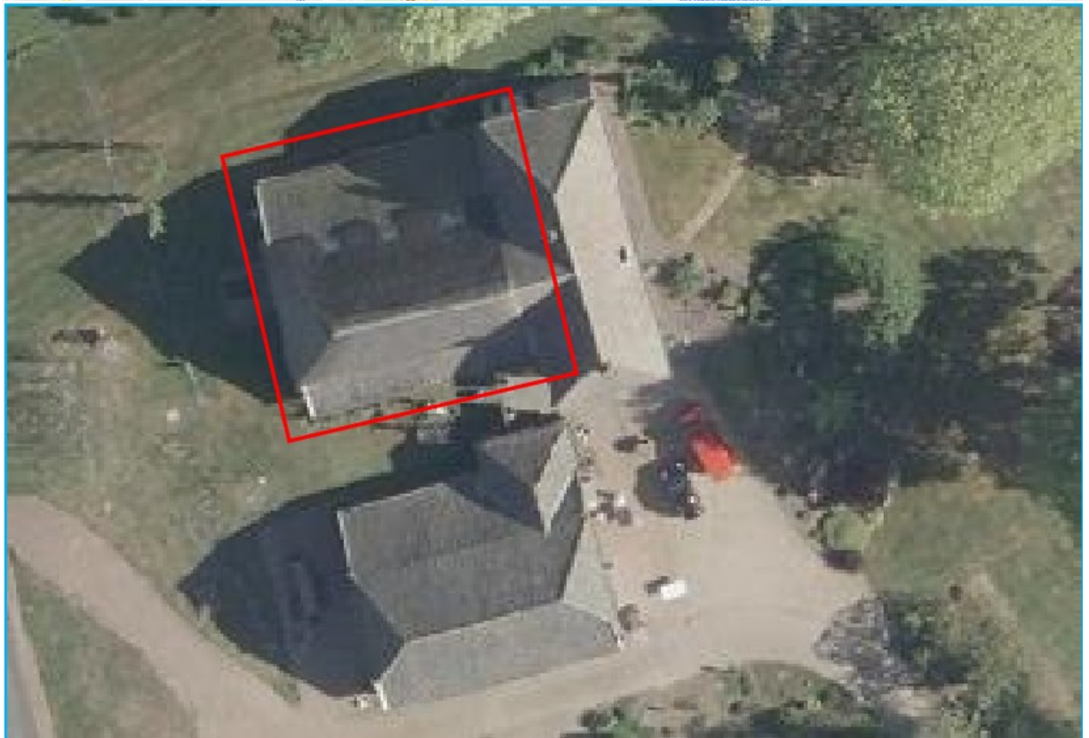
Figuur 1 Ligging en begrenzing van het plangebied (rood omkaderd).