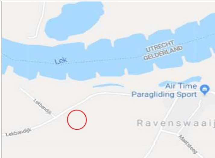
Figuur 1. Ligging plangebied