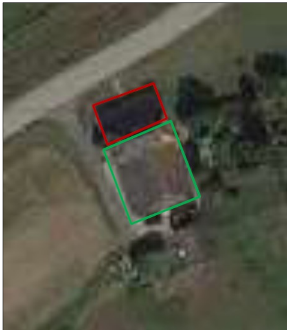
Figuur 2. Begrenzing van de woning waar de werkzaamheden worden uitgevoerd (rood kader) en het deel waar geen werkzaamheden worden uitgevoerd (groen kader).