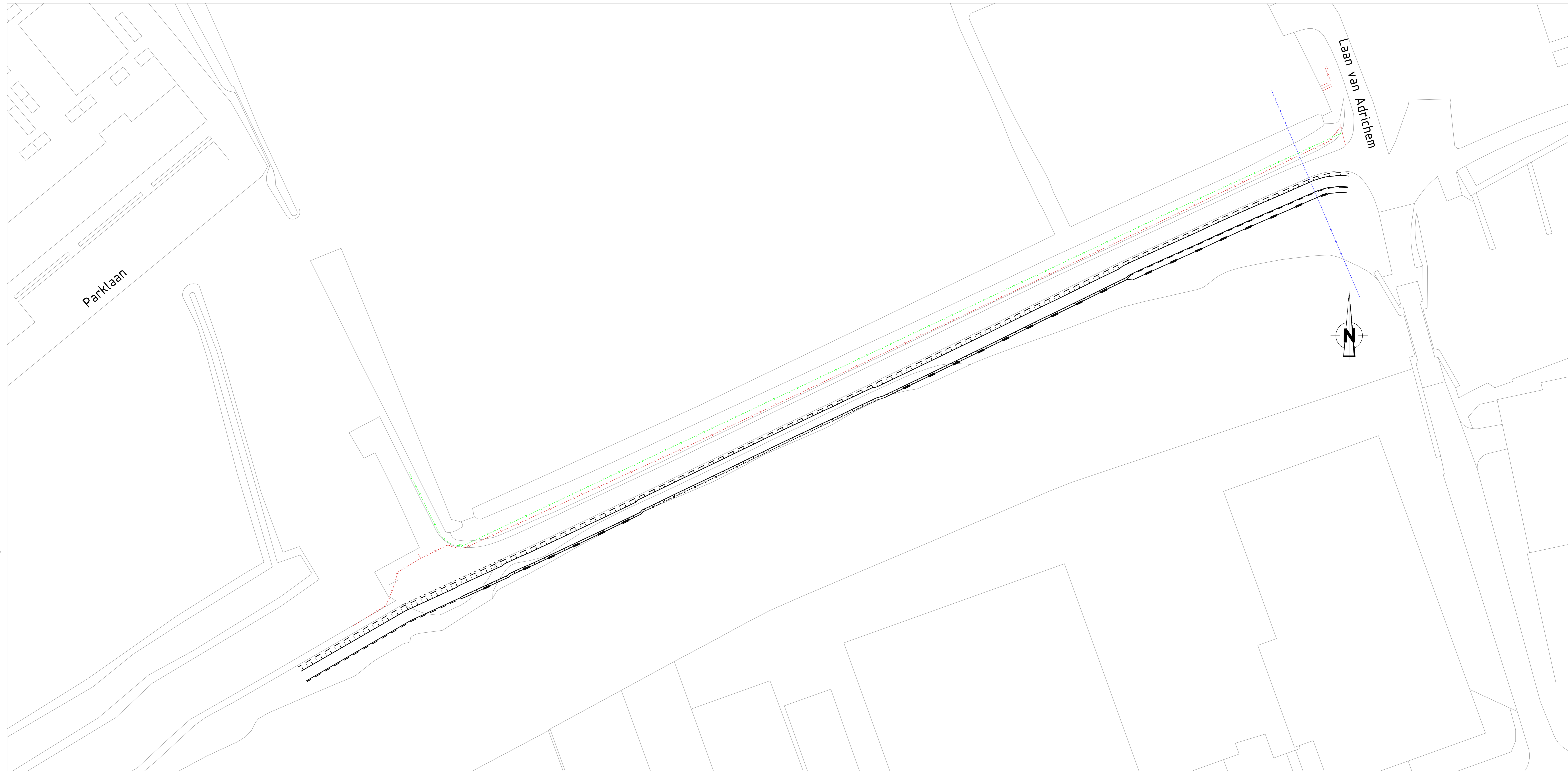
Bovenaanzicht Schaal 1:250