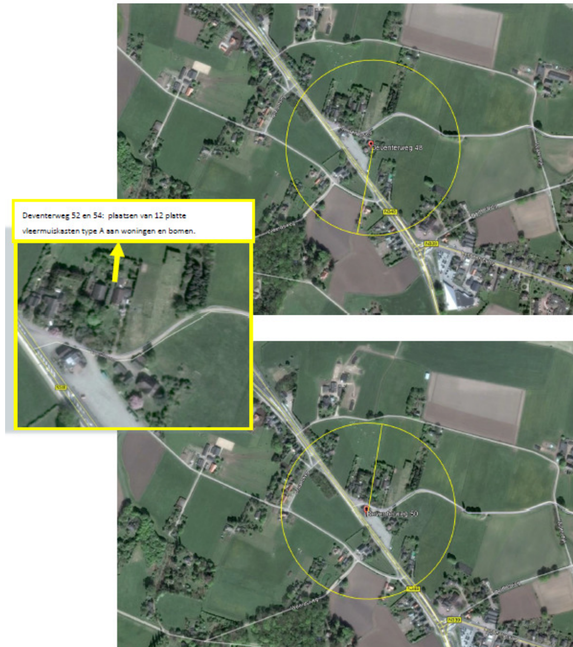
Figuur 1. Locaties vervangende verblijfplaatsen voor de gewone en ruige dwergvloermuis t.o.v. Deventerweg 48 en 50