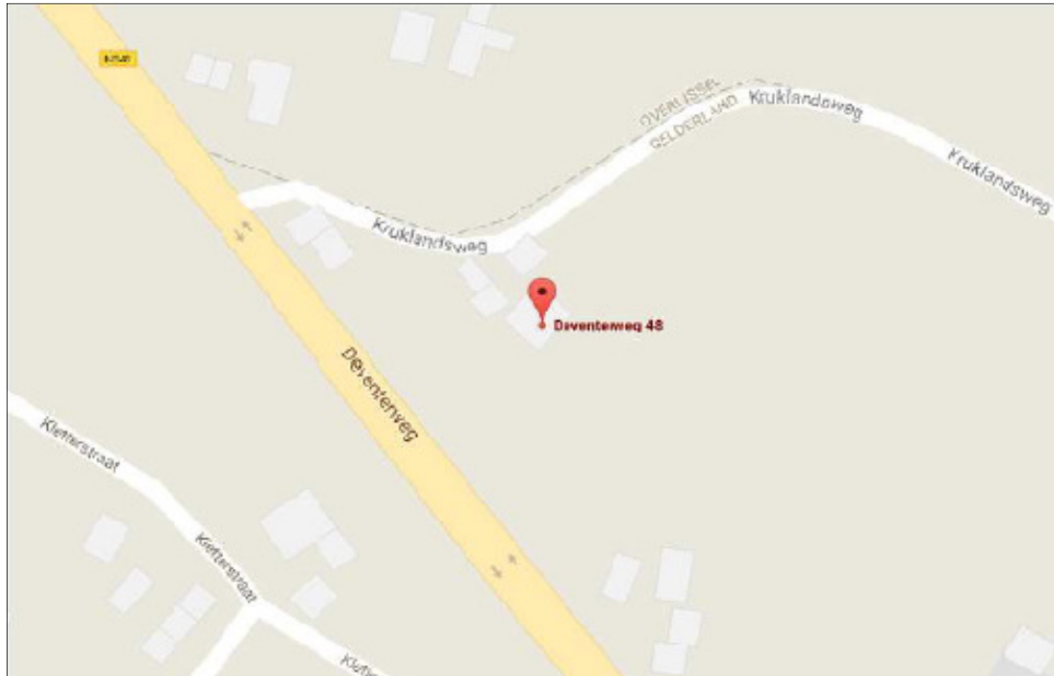
Figuur 1. Locatie plangebied