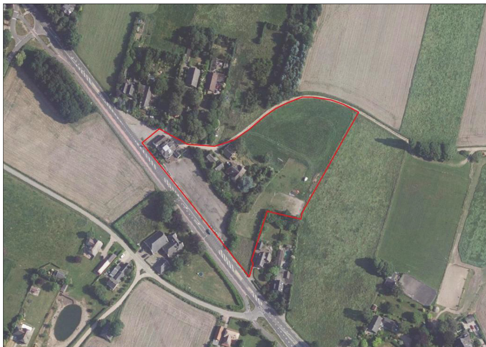
Figuur 2. Ligging van het plangebied. Aan de Deventerweg ligt het voormalige truckerscafé met een grote parkeerplaats. In het midden van het plangebied ligt aan de zandweg Kruklansweg een boerderijwoning met schuren en beplanting.