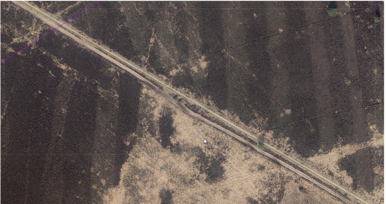
Luchtfoto van fietspad Speulderveld waarop aan de noordzijde het beheer-/menpad te zien is.