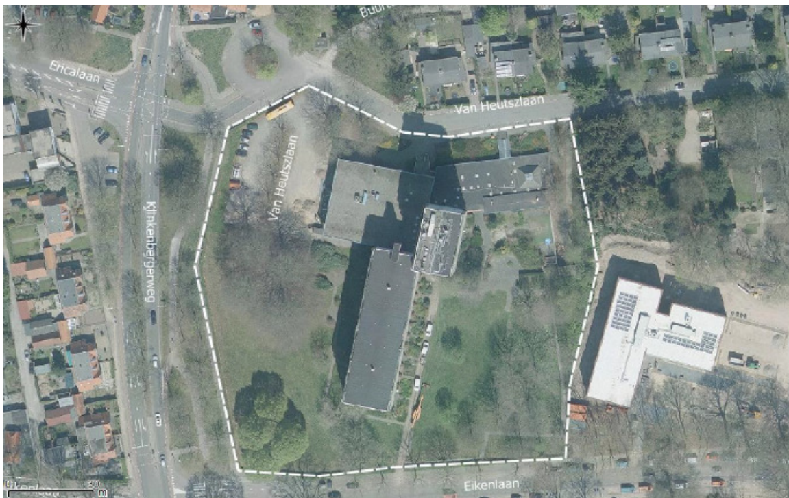
Figuur 2 Begrenzing plangebied (wit omljnd).