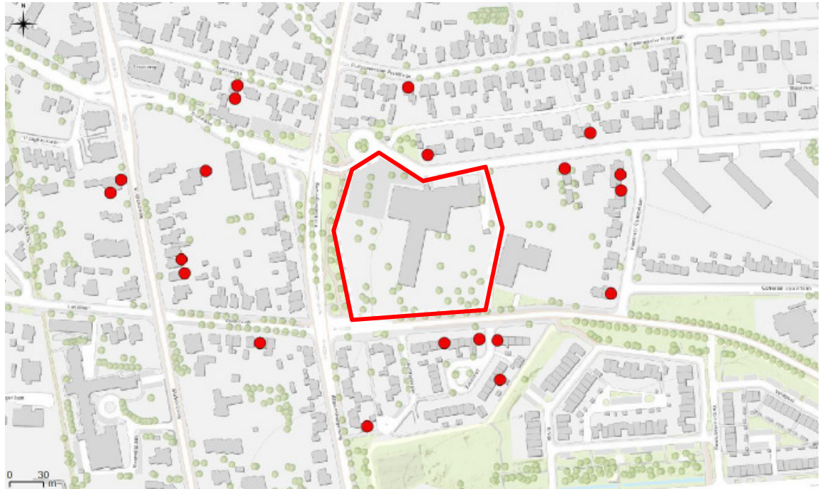
Figuur 3 Locaties van de aangebrachte vleermuiskasten (rode stippen) op 15 februari 2018 rondom het plangebied (rood omlijnd).