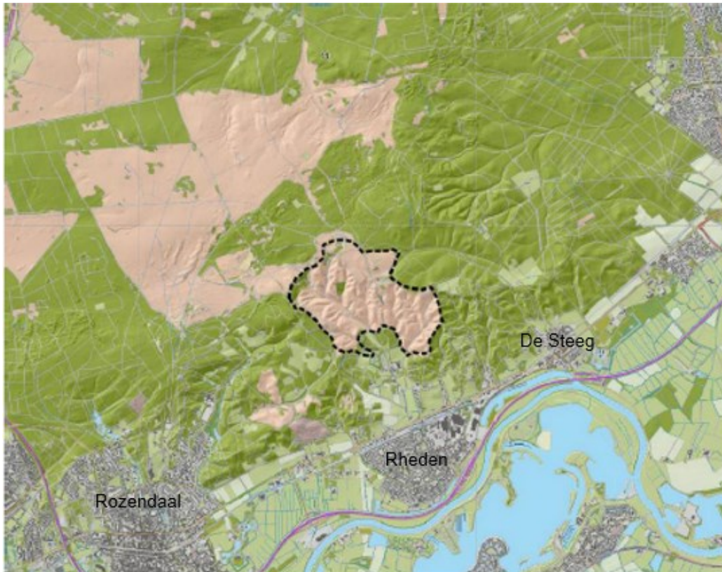
Figuur 1 Ligging en begrenzing plangebied in het Nationaal Park Veluwezoom