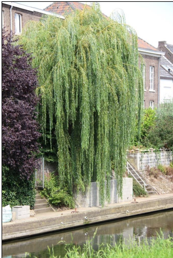
Bijlage 1: Foto's van het bouwwerk bij de Roer