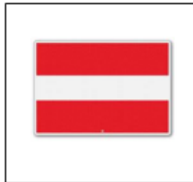
In-, uit- of doorvaart verboden (BPR, bijlage 7, A.1)

dat de duur van de stremming, kenbaar wordt gemaakt door middel van een informatief bord met de volgende tekst;