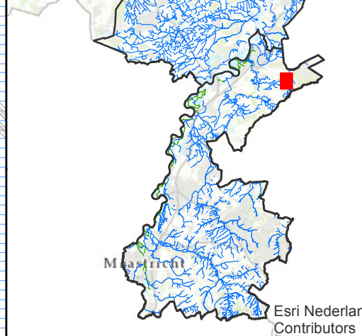
Overzichtskaartje (schaal 1:1.000.000)