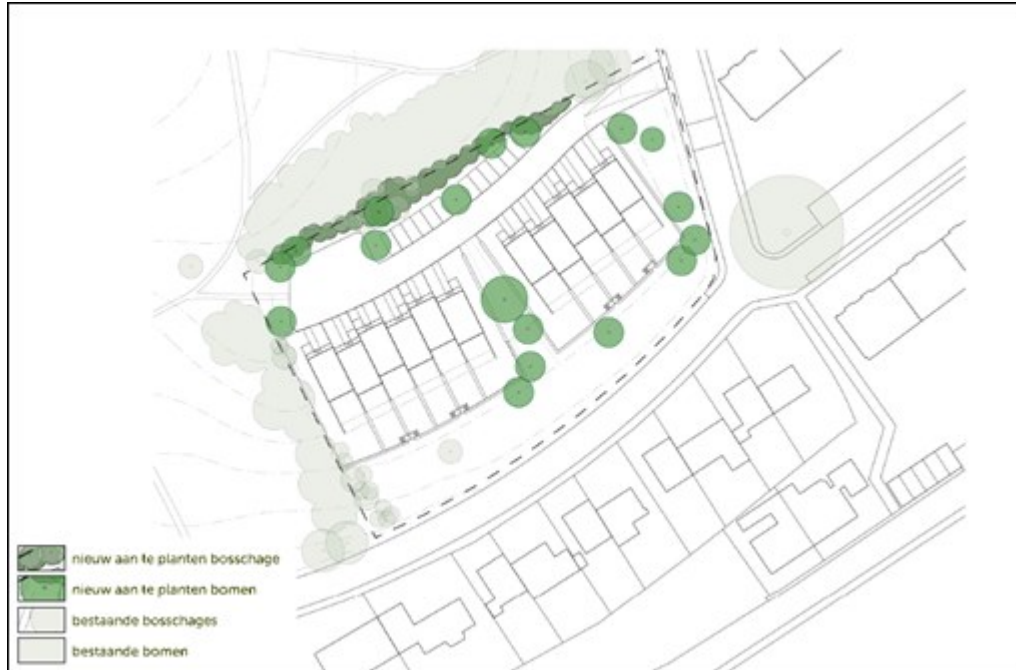
Figuur 3. Stedenbouwkundige visie aanplant bomen en bosschage.