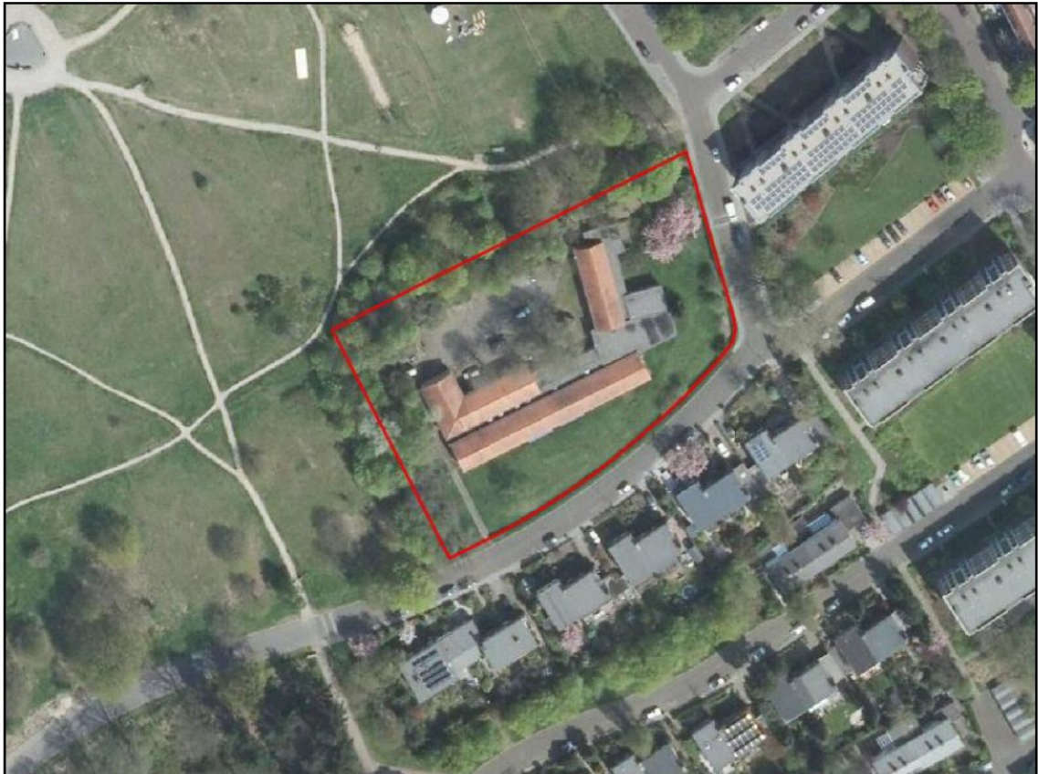
Figuur 1. Ligging en begrenzing plangebied Dominee Bechtlaan 1 te Arnhem (rode lijn). Het slopen van de bebouwing maakt geen onderdeel uit van deze ontheffing.