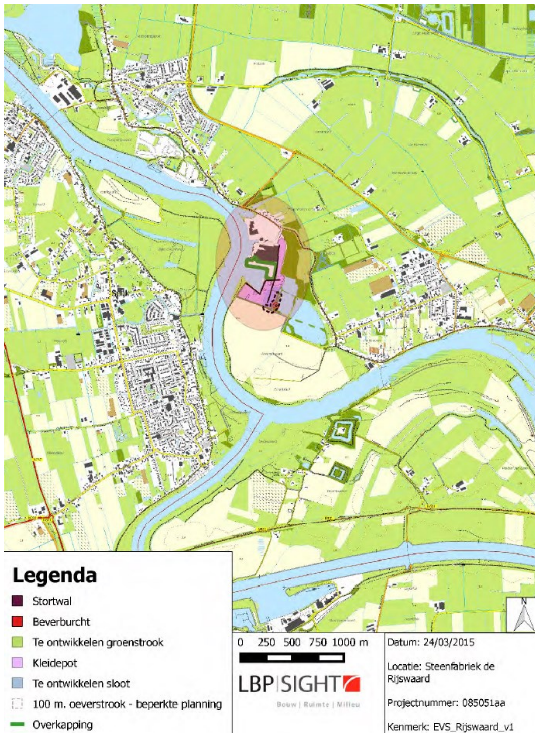
Figuur 1 Ligging van het projectgebied