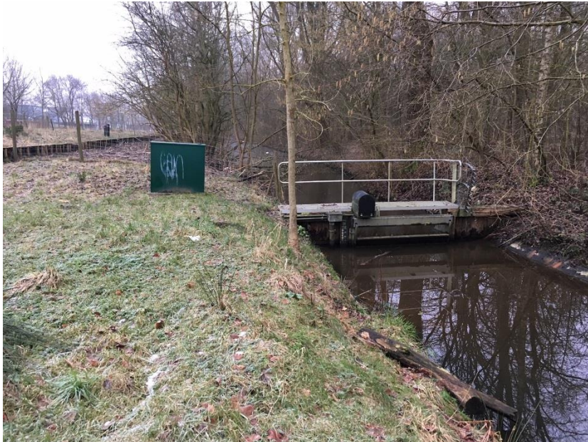
Figuur 1: Huidige situatie van de Stadsparkstuw

Aanleiding van het plan is de staat van de Stadsparkstuw KST0034 en de realisatie van de opdracht om het Stadspark als waterbergingsgebied te kunnen laten functioneren. De huidige stuw is lek en de stuwconstructie voldoet niet aan de eisen van het plan.