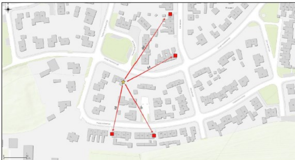
Figuur 3. Locaties van vleermuiskasten voor laatvlieger. Alle kasten zijn gesitueerd binnen 60 tot 90 meter afstand van de huidige verblijfplaats.

De locaties van de kasten zijn weergegeven in figuur 3 en tabel 1. Met de bewoners is afstemming geweest en voor de betreffende locaties is de geschiktheid door een ecologisch bureau beoordeeld.