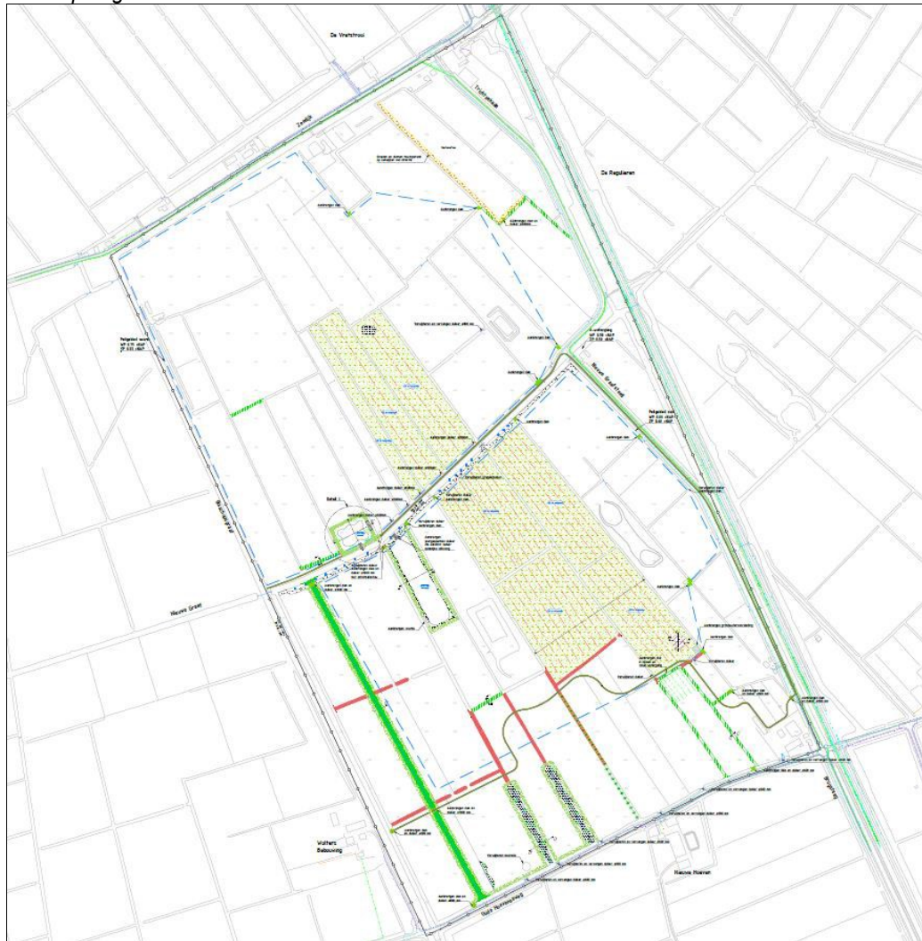
Figuur 2: Ligging van het plangebied Leidsche Hoeven en een overzicht van te nemen maatregelen binnen het plangebied.