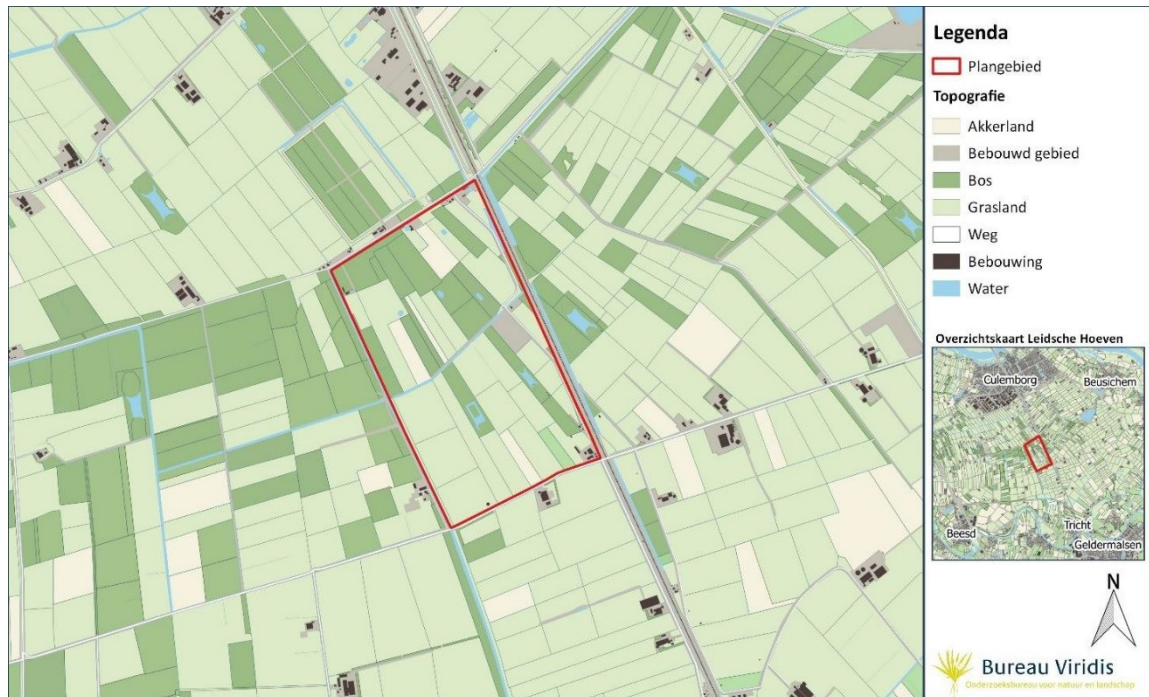
Figuur 1: Ligging van het plangebied Leidsche Hoeven te Geldermalsen, ten zuiden van Culemborg. Het plangebied heeft een oppervlakte van ca. 100 ha.