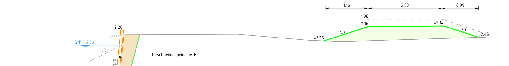
PROFIEL 15-16 Schaal 1:50