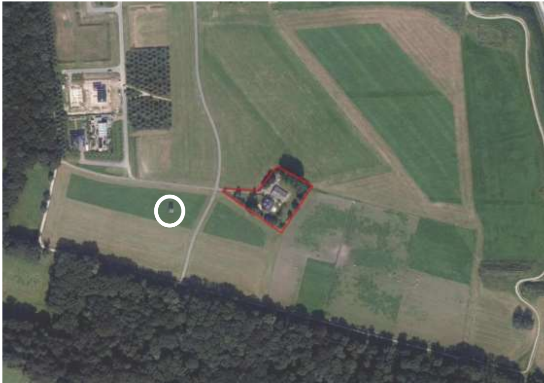
Figuur 1. Locatie te slopen woning en erf (rode omlijning). De 'Vogelkooi' is met wit omcirkeld.

De werkzaamheden staan gepland voor de periode oktober-november 2018. De doorlooptijd van de sloop van de woning wordt ingeschat op 2 maanden.