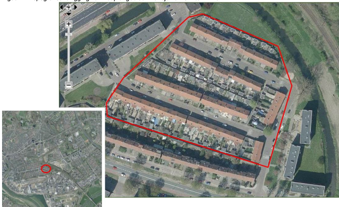
Figuur 1: Topografische ligging van het plangebied Eilandje van Urk te Arnhem.