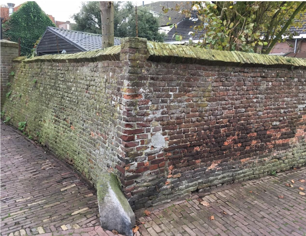
Historisch muurwerk in de kern Oirschot

De gemeente heeft in haar bestemmingsplannen objecten aangeduid als cultuurhistorisch waardevol object, beeldbepalend object of karakteristiek pand. Deze objecten zijn van bijzondere waarde vanwege hun massa, typologie of verschijningsvorm. Bij deze laatste categorie worden alleen de gevels en de bouwmassa beschermd. Dit is een lichte bescherming met minder lasten voor de burger maar met behoud van de karakteristieke identiteit van de streek.