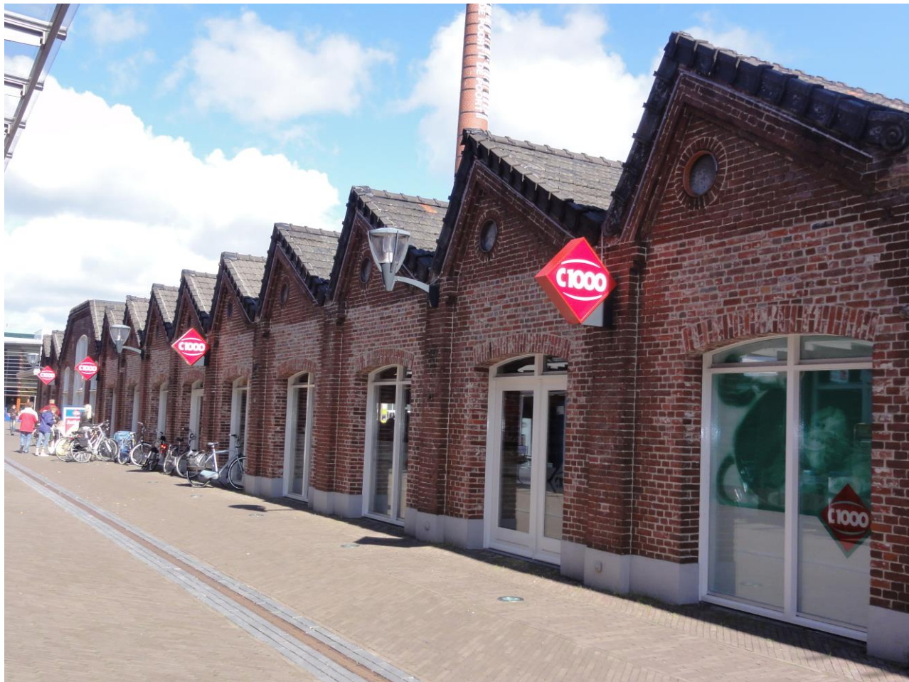
Voormalige fabriek Rijkeluistraat

organisatie Visit Oirschot (samenvoegen van Centrummanagement, Ondernemend Oirschot, VVV). Ook de vastgoedeigenaren krijgen hierin een rol. Daarnaast zijn we nauwer gaan samenwerken met Eindhoven om gebruik te maken en te leren van het aantrekken van de gewenste c.q. passende retail, hospitality en cultuur in ons historisch centrum.