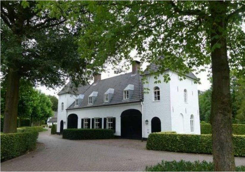
Landgoed Baest