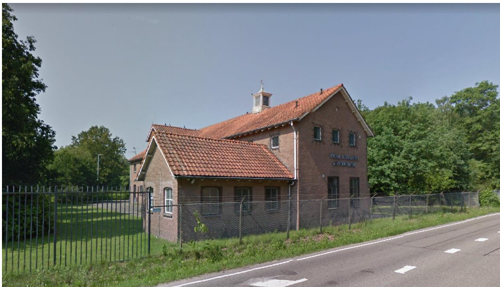
Het poortgebouw van de Generaal Majoor de Ruyter Van Steveninck kazerne in de jaren '50 en 2017