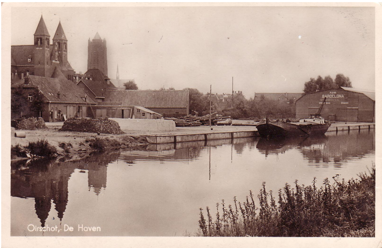
Oude foto van de haven van Oirschot

In dit hoofdstuk schetsen we een beeld van wat Oirschot op het gebied van erfgoed te bieden heeft. Unieke en onderscheidende erfgoedthema's zorgen voor samenhang tussen al het erfgoed. Omdat we willen inzetten op het behoud en de beleving van ons erfgoed benoemen we die erfgoedthema's die onze gemeente uniek en onderscheidend maken. In hoofdstuk 7 geven we aan hoe we de erfgoedthema's inzetten om de beleefbaarheid te vergroten. De volgende erfgoedthema's, dragen allemaal bij aan het verhaal en herkenbaarheid van Oirschot: