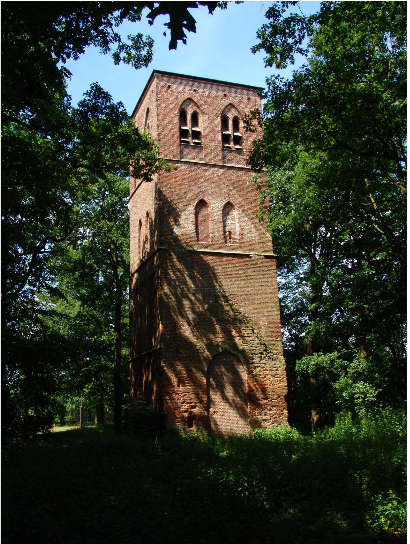
De Oude Toren in Oostelbeers