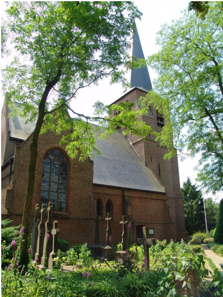
Oude Sint Willibrorduskerk Middelbeers

Toren van Oostelbeers. De Toren van Oostelbeers is één van de weinige overgebleven vrijstaande kerktorens in Brabant. Een plek op de akkers buiten de dorpskern waar de eeuwenlange historie voelbaar is. Ook een markante kerk in de gemeente Oirschot is de Oude Sint-Willibrorduskerk in Middelbeers dat stamt uit de 15e eeuw en in de stijl van de Kempense gotiek is gebouwd.