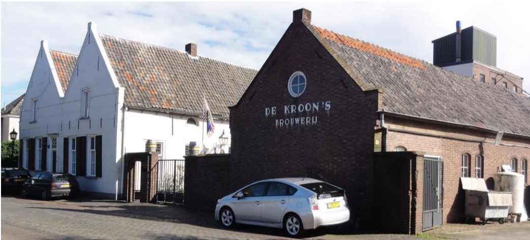
Brouwerij de Kroon aan de Koestraat