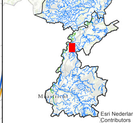
Overzichtskaartje (schaal 1:1.000.000)