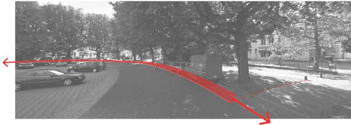
Zone voor voorzieningen definiëren

Er wordt hier primair gedacht aan bollards ingepakt in een klassieke rondgaande haag, eventueel met kleinschalige, aanvullende objecten, zoals een extra hoge trottoirband.