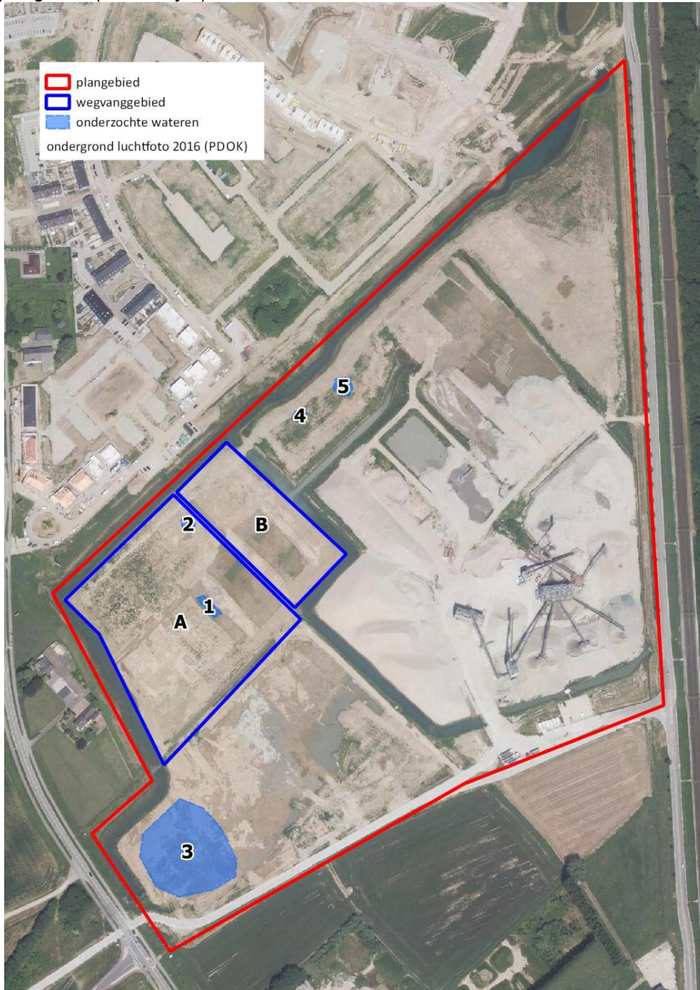
Figuur 2: Overzicht van de ligging van de onderscheiden deelgebieden (blauw omlijnd) in het plangebied (rood omlijnd).