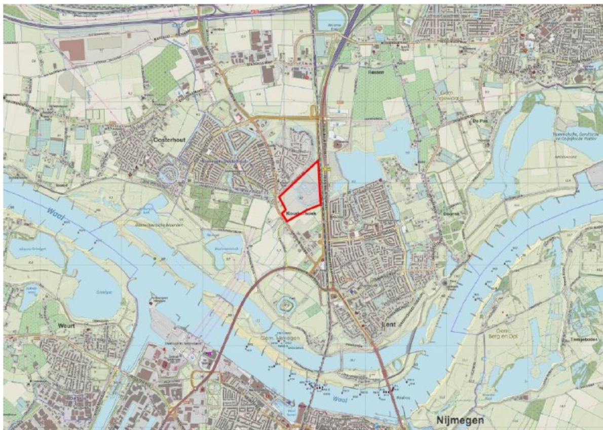
Figuur 1: Begrenzing van het plangebied Oosterhoutse Plas te Nijmegen-Noord (binnen de rode omlijning).