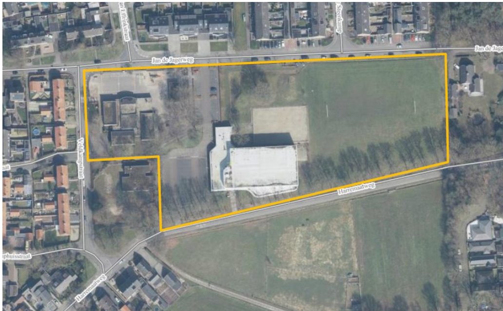
Figuur 1: Luchtfoto van het plangebied (oranje contour).

Basisschool De Hoeksteen aan Veldkampstraat 1 en kantine sporthal Jan de Jagerweg.