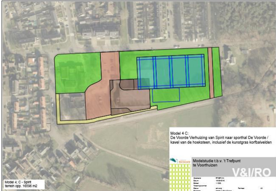
Figuur 2: Tekening geplande ontwikkeling De Voorde.

De groene zone aan de oostzijde wordt ingericht en onderhouden als soortenrijk gras.