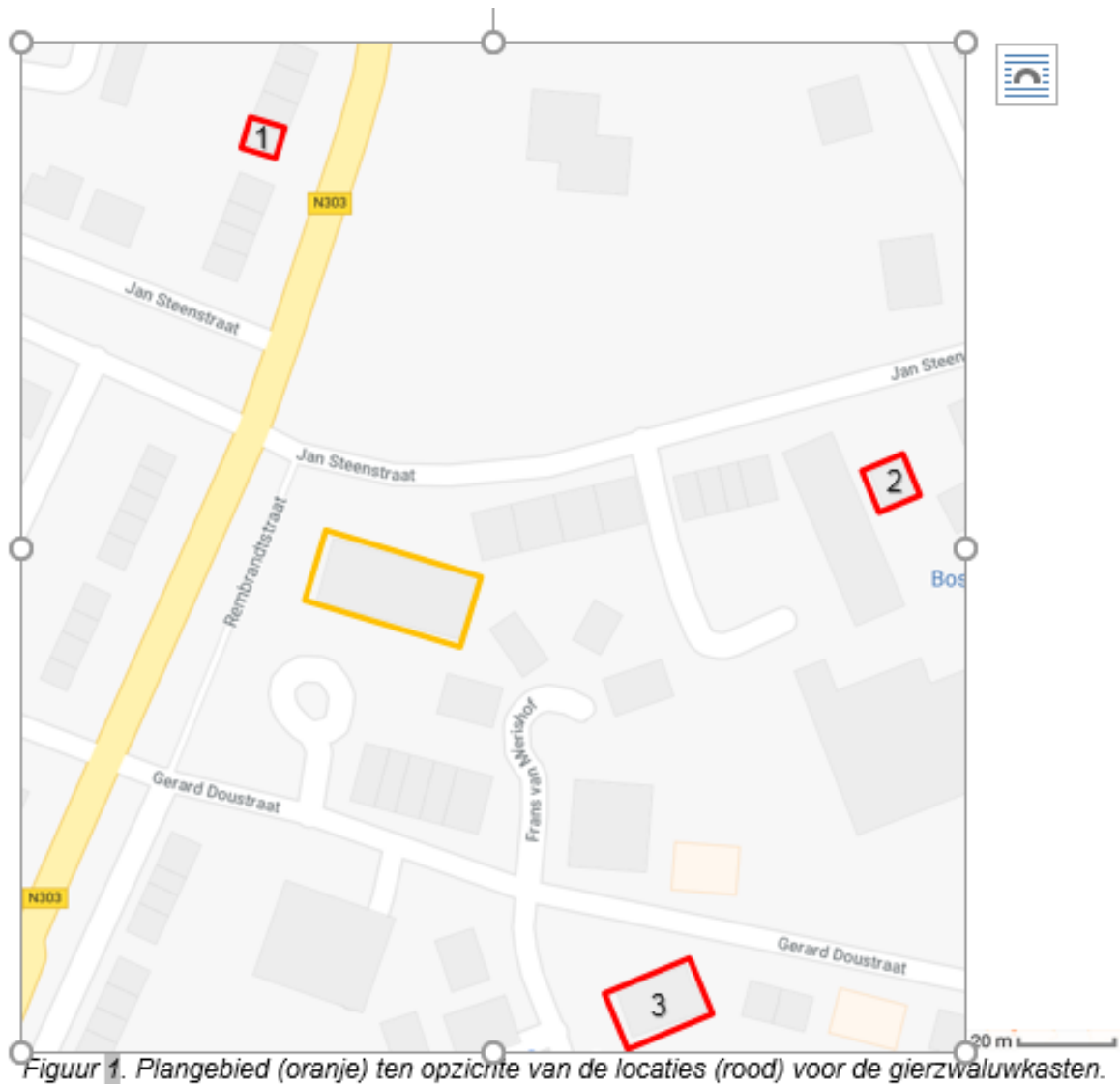
Figuur 1. Plangebied (oranje) ten opzichte van de locaties (rood) voor de gierzwaluwkasten.

BIJLAGE 2 Locaties voor de tijdelijke alternatieve gierzwaluwkasten type NK GZ 08 (www.vivarapro.com) aan Rembrandtstraat 22, Wheemstraat 10 en Jan Steenstraat 102.