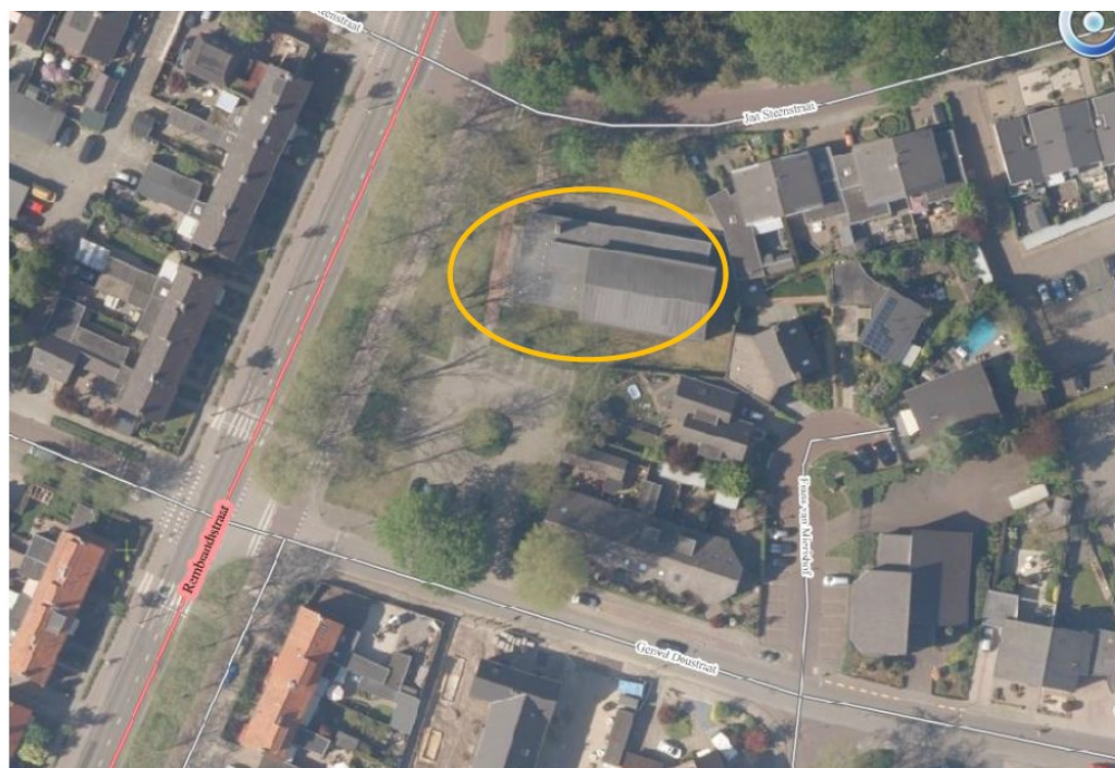
Figuur 1: Luchtfoto van de gymzaal De Brug (oranje contour).