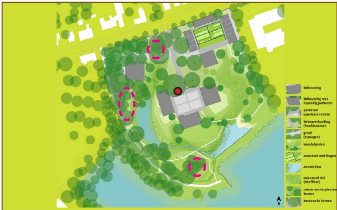
Figuur 3. Locaties van aan te brengen tijdelijke (rode stippellijnen) en permanente vleermuisverblijfplaatsen (ter plekke van de rode stip) in de te renoveren villa.