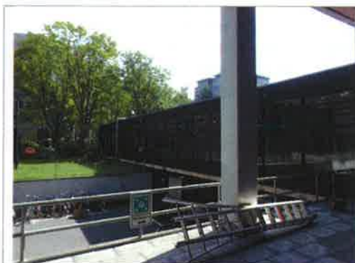
Foto 1: In overleg met eigenaren en gebruikers zijn vleermuizenkasten aan een naastgelegen pand aangebracht.

De aangebrachte vleermuizenkasten betreffen 8 stuks van het type VK MP 01, met een buitenmaat van 28 x 41 x 6,5 cm. Dit type vleermuizenkast betreft een platte kast die geschikt is voor zomer- en paarverblijven van gewone dwergvleermuizen.