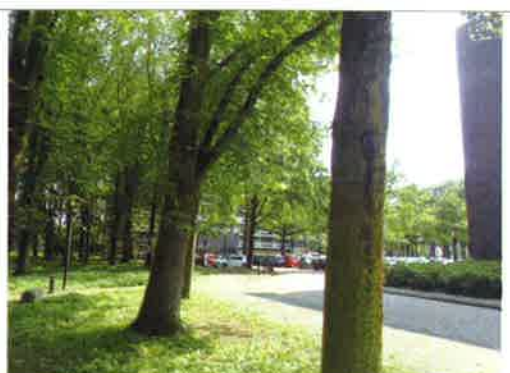
Foto 2: Aan bomen nabij het plangebied zijn kasten opgehangen. Het plangebied is rechts zichtbaar, links van het midden is een kast zichtbaar.