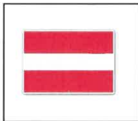
In-, uit- of doorvaart verboden (BPR, bijlage 7, A.1)