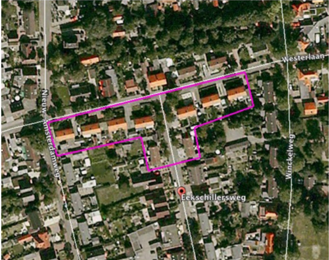
Figuur 2: Luchtfoto met ligging van het plangebied