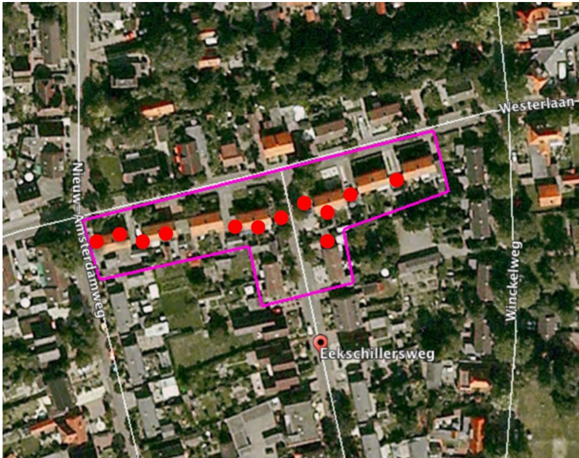
Figuur 4: Plaatsing tijdelijke mussenkasten