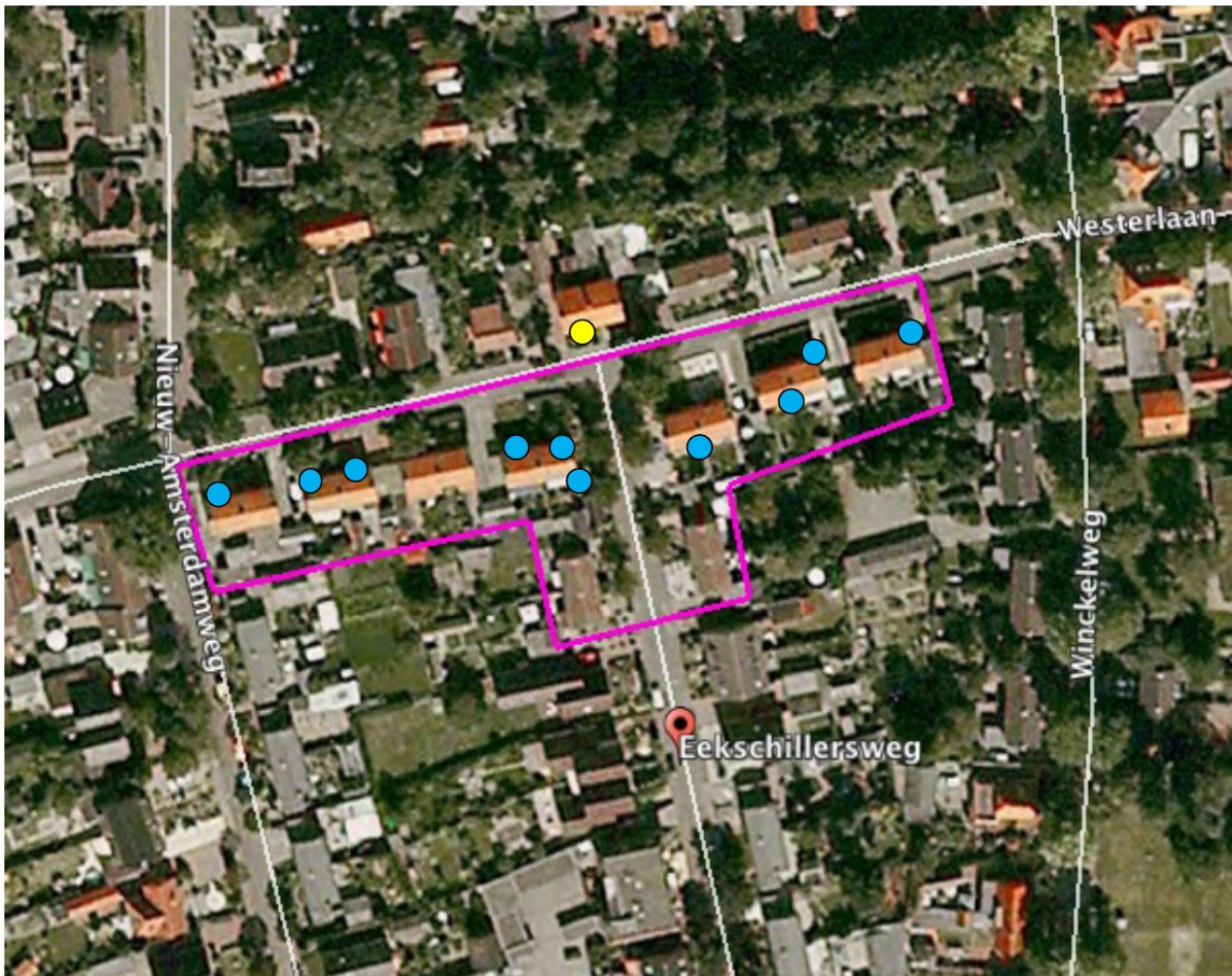
Figuur 3: Territoria/nesten van Huismus (blauw) en Gierzwaluw (geel)