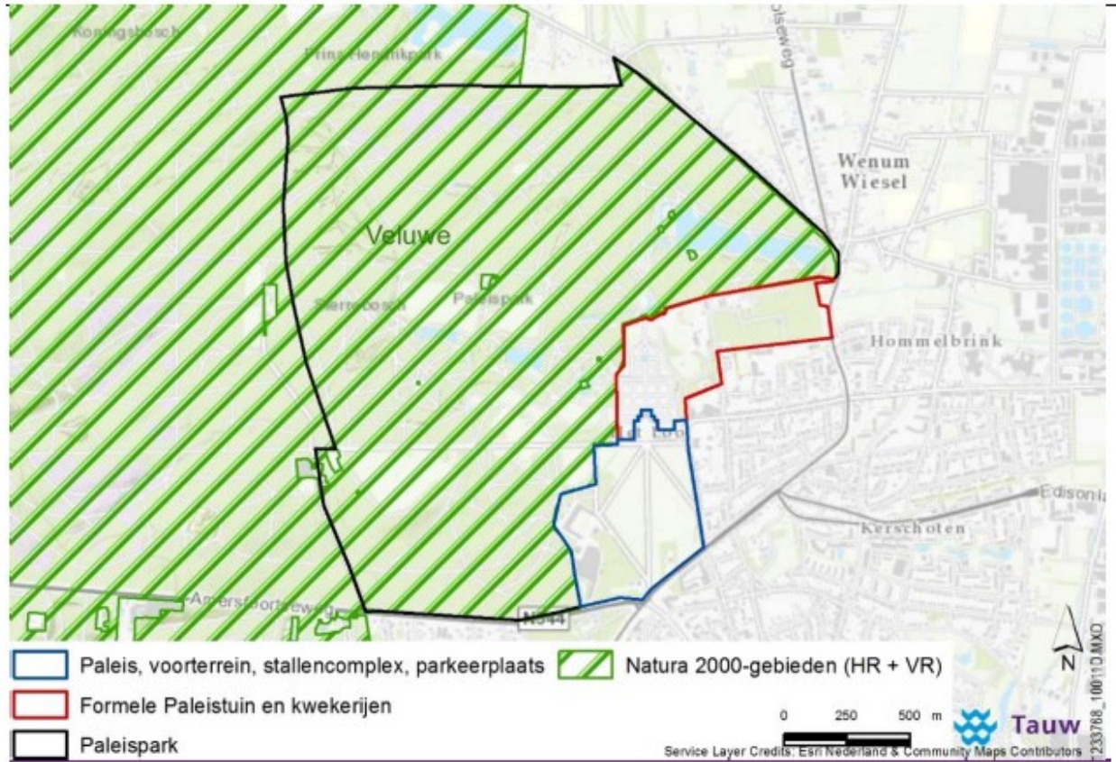
Figuur 1 De begrenzing van het paleis, de paleistuin en het paleispark en de ligging t.o.v. Natura 2000-gebied 'Veluwe'.