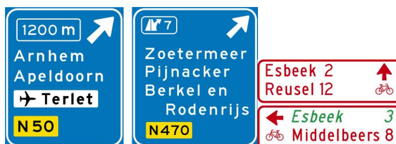
Voorbeelden bewegwijzering uit hoofdstuk K

De gemeente Echt-Susteren blijft verantwoordelijke voor de feitelijke plaatsing en het onderhoud van de borden. Dit kan wel ondergebracht worden bij de NBd maar valt niet onder de wettelijke taken.