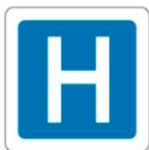
(Inter)nationaal herkenbaar pictogram voor ziekenhuis

Uniformiteit betekent onder andere dat in het gehele land in soortgelijke situaties op eenzelfde wijze wordt verwezen. Hiernaast moeten de systematiek, de gebruikte kleuren, het lettertype en het symboolgebruik uniform zijn.