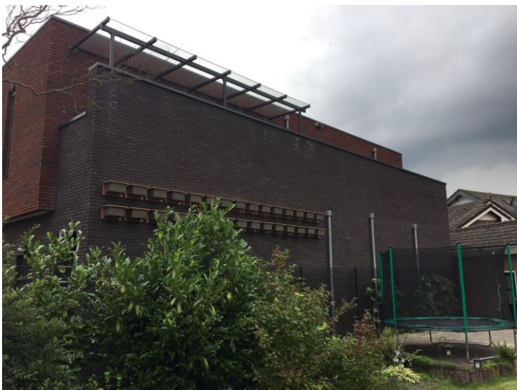
Figuur 3-2 Dertig stuks gierzwaluwkasten op oostelijke gevel aan Smidsplein.