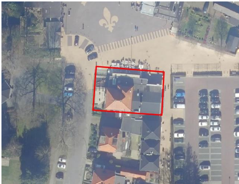
Figuur 2 Begrenzing van het projectgebied