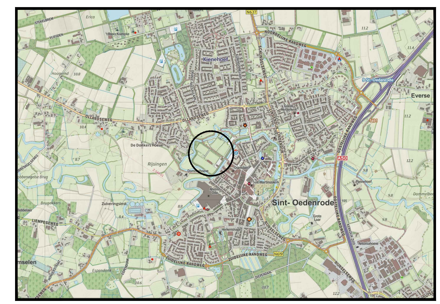
Overzicht van de situatie