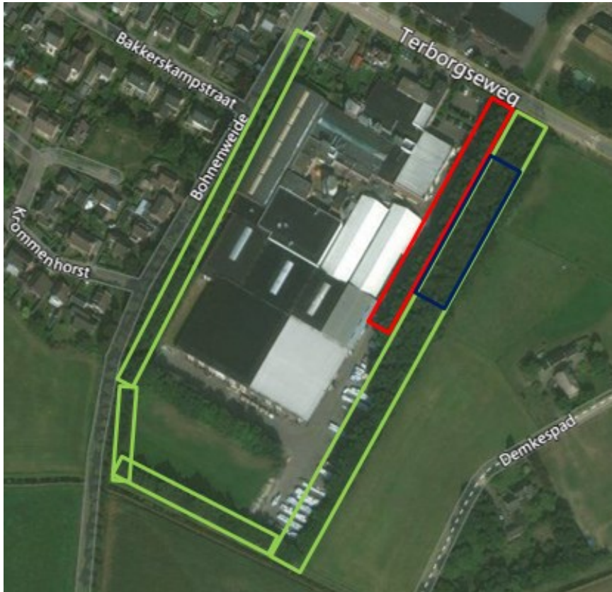
Figuur 1 Rood omkaderd vlak is het te kappen deel van de groenstrook; blauw omkaderd vlak is het deel waar de nesten van de Roek behouden blijven; groen omkaderd vlakken zijn de te behouden groenstroken. Daar waar het rode en blauwe vlak elkaar raken, zullen drie nesten van de Roek aangetast worden.