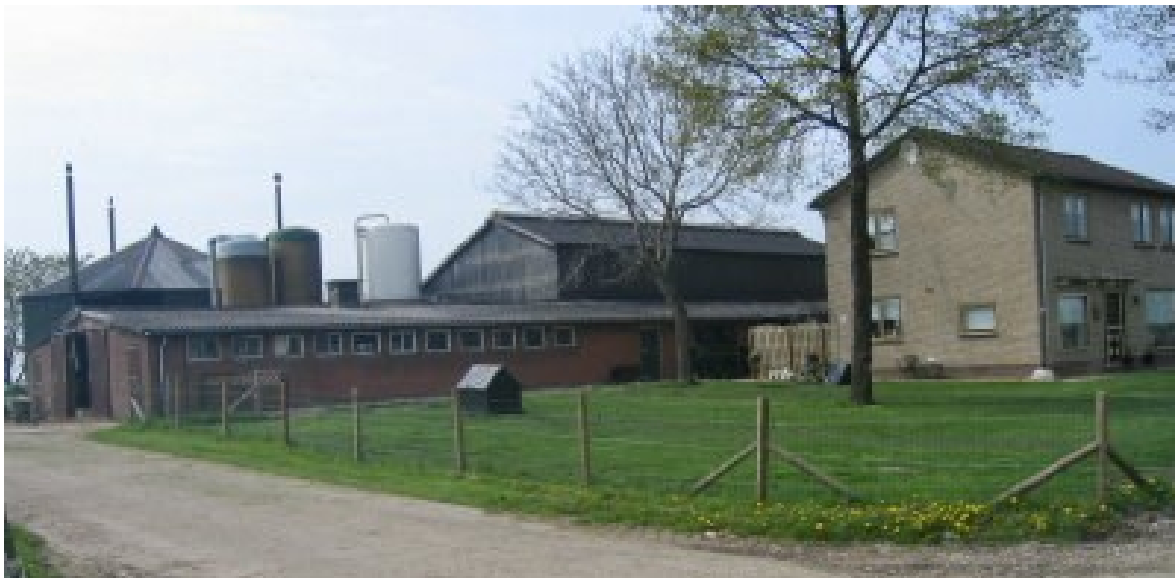
Bij functieverandering moeten alle agrarische gebouwen op het perceel gesloopt worden

Bij het berekenen van de oppervlakte van de gesloopte bedrijfsgebouwen worden overigens alleen de bedrijfsgebouwen (stallen/loodsen/glasopstanden/opslagruimtes) meegerekend. Aan de sloop van bouwwerken, bij recht toegestane bijgebouwen bij de woning, tunnelkassen en overige voorzieningen kunnen dus geen bouw mogelijkheden worden ontleend.