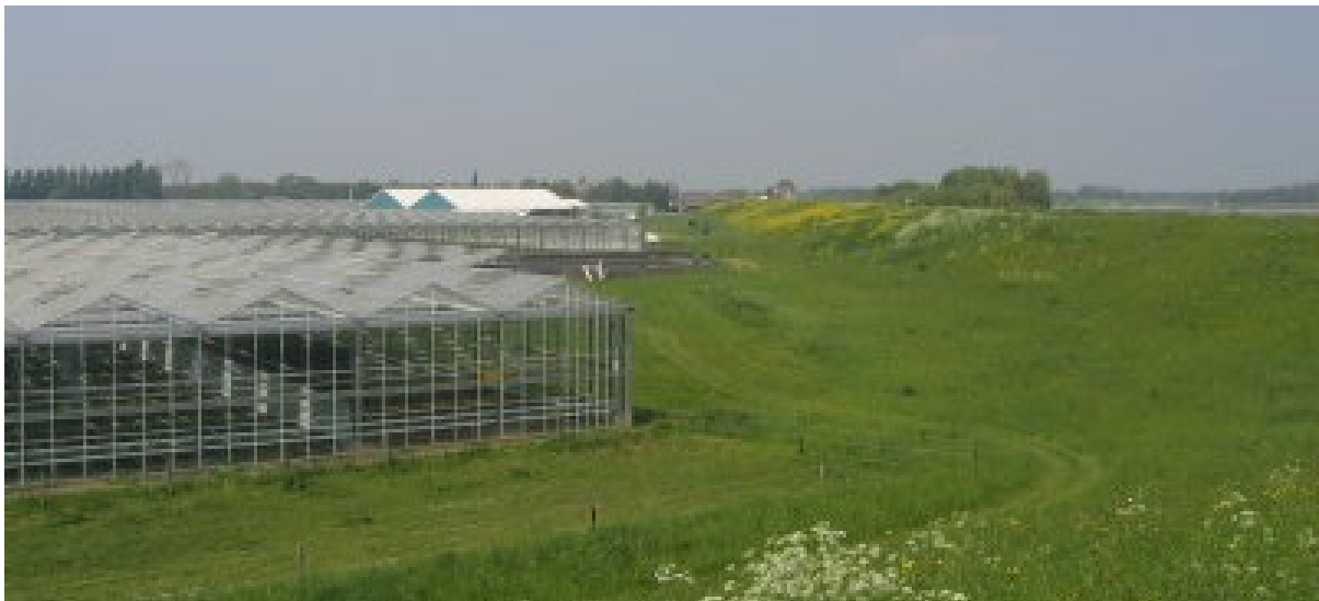
Sloop van kassen ten behoeve van het vergroten van de landschappelijke kwaliteit van het buitengebied

In gebieden die zijn aangewezen als (glas)tuinbouwconcentratiegebied, -intensiveringsgebied of -reserveconcentratiegebied worden geen mogelijkheden geboden voor het oprichten van nieuwe woon- en bedrijfsgebouwen in ruil voor de sloop van leegstaand glas. De bouw van woningen en bedrijfsruimte zou de ruimte voor de glastuinbouw beperken en de grondprijs opdrijven. In de regio Rivierenland zijn delen van de Bommelerwaard en gebieden rond Tuil en Est aangewezen als gebieden waar de (glas)tuinbouw in de toekomst geconcentreerd zal worden.