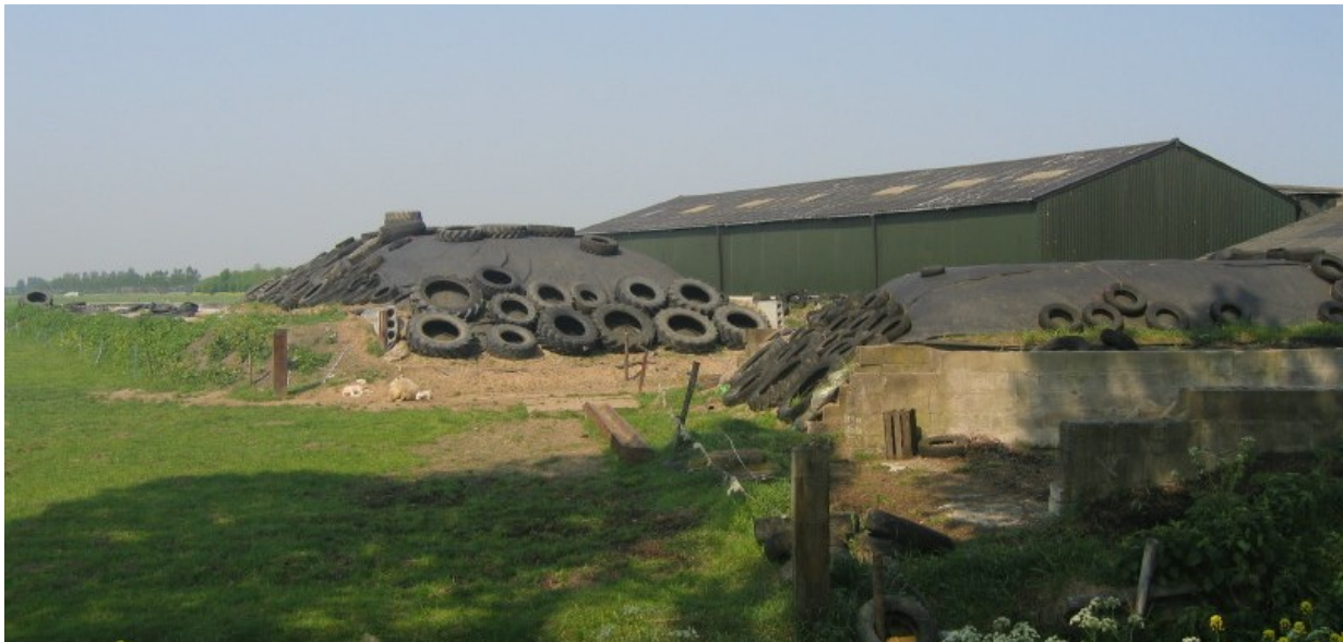
Landschappelijke kwaliteit buitengebied vergroten door sloop van landschapsontsierende agrarische bebouwing