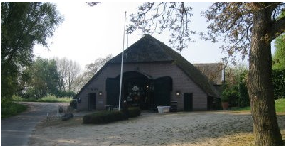
Het buitengebied is een aantrekkelijke vestigingsplaats voor bepaalde bedrijven

De gemeenten in de regio Rivierenland zijn van mening dat de vestiging van bedrijvigheid in vrijgekomen agrarische bedrijfsgebouwen een impuls kan geven aan de aantrekkelijkheid en vitaliteit van het buitengebied. Dat wil echter niet zeggen dat het buitengebied geschikt is voor alle soorten bedrijvigheid. In de visie van de gemeenten zou in het buitengebied onder de voorwaarden zoals geformuleerd in paragraaf 2.1 plaats moeten zijn voor bedrijvigheid die agrarisch verwant of aan het buitengebied gebonden is, recreatieve voorzieningen en overige kleinschalige bedrijvigheid die qua karakter en uitstraling in het buitengebied past. Grootschalige bedrijvigheid of bedrijvigheid die qua uitstraling niet in het buitengebied past, behoort zich op een bedrijventerrein te vestigen.