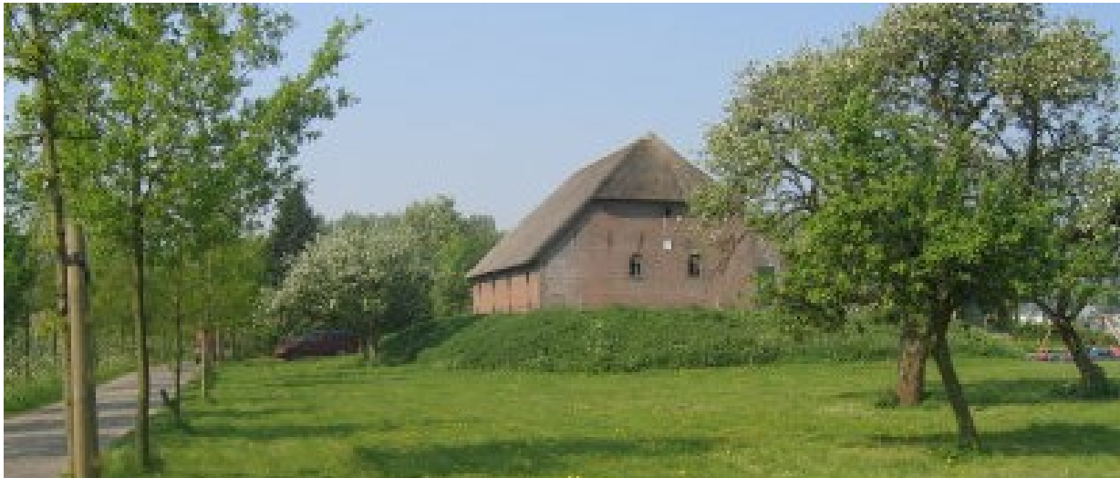
Behoud van monumentale bedrijfsgebouwen door ruime mogelijkheden voor hergebruik