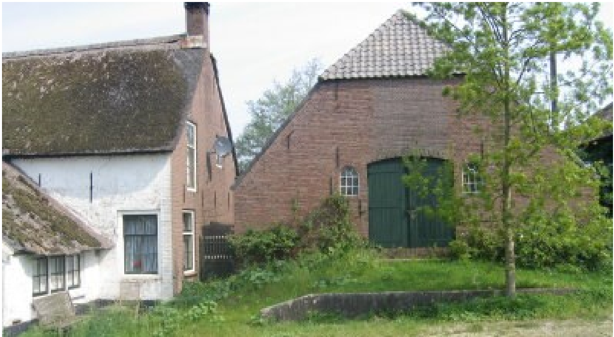
Agrarische bebouwing met monumentale, karakteristieke en/of beeldbepalende waarde

Agrarische bedrijfsbebouwing in het buitengebied die zijn functie waarvoor deze eerder is bestemd, vergund en gebruikt heeft verloren of op korte termijn gaat verliezen.