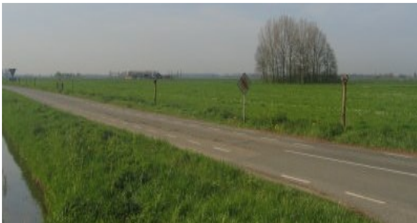
Karakteristiek open komgebied

De komgebieden worden gekenmerkt door hun landschappelijk open karakter. Het zijn laaggelegen en relatief natte gebieden die van oudsher niet geschikt waren voor bebouwing. De gebieden werden veelal gebruikt voor melkveehouderij. In de jaren vijftig en zestig van de vorige eeuw zijn als gevolg van de ruilverkaveling linten van boerderijen gebouwd door de kommen. De agrarische bedrijven die in de komgebieden zijn gevestigd zijn relatief omvangrijke melkveehouderijen. De agrarische bedrijfsgebouwen zijn relatief nieuw en bestaan uit een combinatie van bakstenen schuren en damwandloodsen. De verwachting is dat de agrarische sector in de komgebieden meer toekomstperspectief heeft dan op de oeverwallen. De meeste gronden zullen dan ook agrarisch gebruikt blijven worden. Wel zal door schaalvergroting een deel van de bedrijven verdwijnen waarna de agrarische bedrijfsgebouwen leeg komen te staan. Daarbij gaat het om relatief grote oppervlaktes in de vorm ligboxenstallen. Hergebruik is soms een goede optie maar niet altijd wenselijk vanuit ruimtelijk en landschappelijk oogpunt.