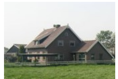
Sanering van verspreid liggende agrarische bebouwing kan een belangrijke bijdrage leveren aan het vergroten van de landschappelijke kwaliteit van het buitengebied