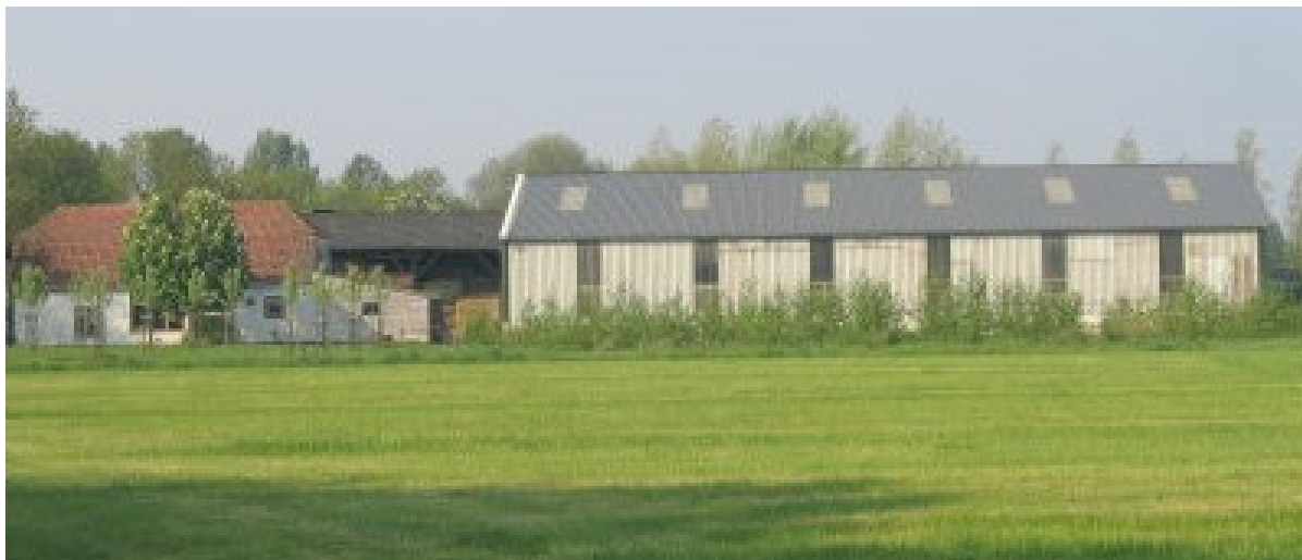
Sloopkosten van vrijgekomen agrarische bebouwing kunnen worden bekostigd uit extra te verkrijgen bouwmogelijkheden

In de paragrafen 3.2 t/m 3.6 wordt uitgebreid ingegaan op de bovengenoemde mogelijkheden. De regeling is bedoeld om waardevolle vrijgekomen agrarische bedrijfsbebouwing te behouden en landschaps-ontsierende bebouwing te saneren om zodoende de ruimtelijke en landschappelijke kwaliteit van het buitengebied te vergroten. Bij de sloop van grote hoeveelheden agrarische bedrijfsbebouwing kunnen de sloopkosten en de restwaarde van de bebouwing worden "terugverdiend" door de bouw van één of meerdere woningen. De sloop van relatief geringe hoeveelheden agrarische bedrijfsbebouwing (< 1000 m 2 ) kan worden "terugverdiend" door de verruimde mogelijkheden die de gemeenten bieden voor de bouw van extra bijgebouwen of uitbreiding van de bestaande woning.