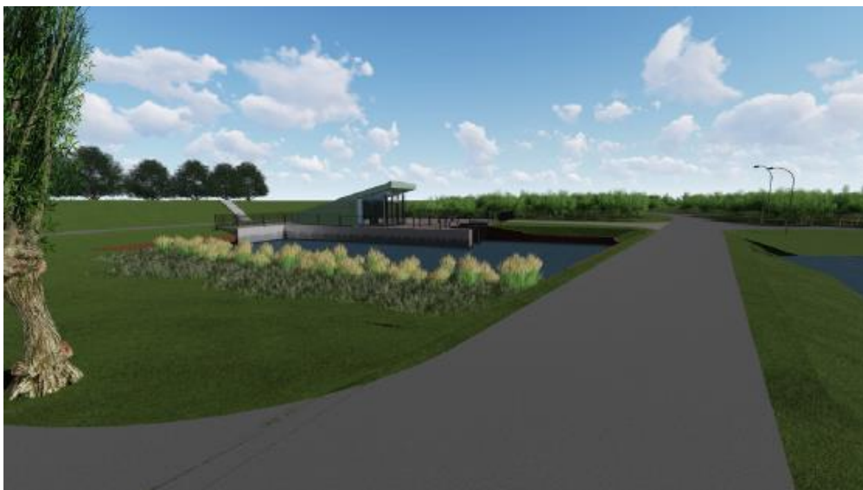
Impressie nieuwe gemaal langs de Dorppolderweg