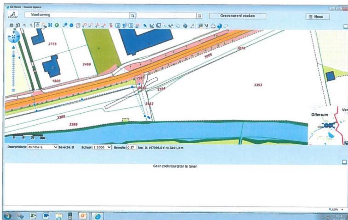
Opgang dijk Kleefseweg Ottersum, tegenover Roepaen (Kleefseweg 9 Ottersum) OTS00E2980

Behorende bij de vergunning van het dagelijks bestuur van heden, nr. 2018-Z11546.