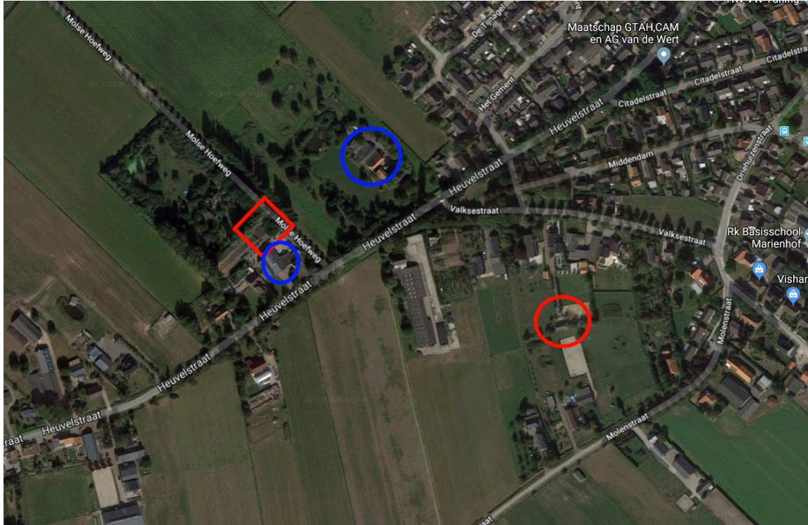
Figuur 3: Ligging kapschuur waarin permanente voorzieningen voor de Gewone grootoorvleermuis worden gerealiseerd (rode cirkel) ten opzichte van het plangebied (rode vierkant). De blauwe cirkels geven de aardappelschuur en een loods naast het plangebied aan.