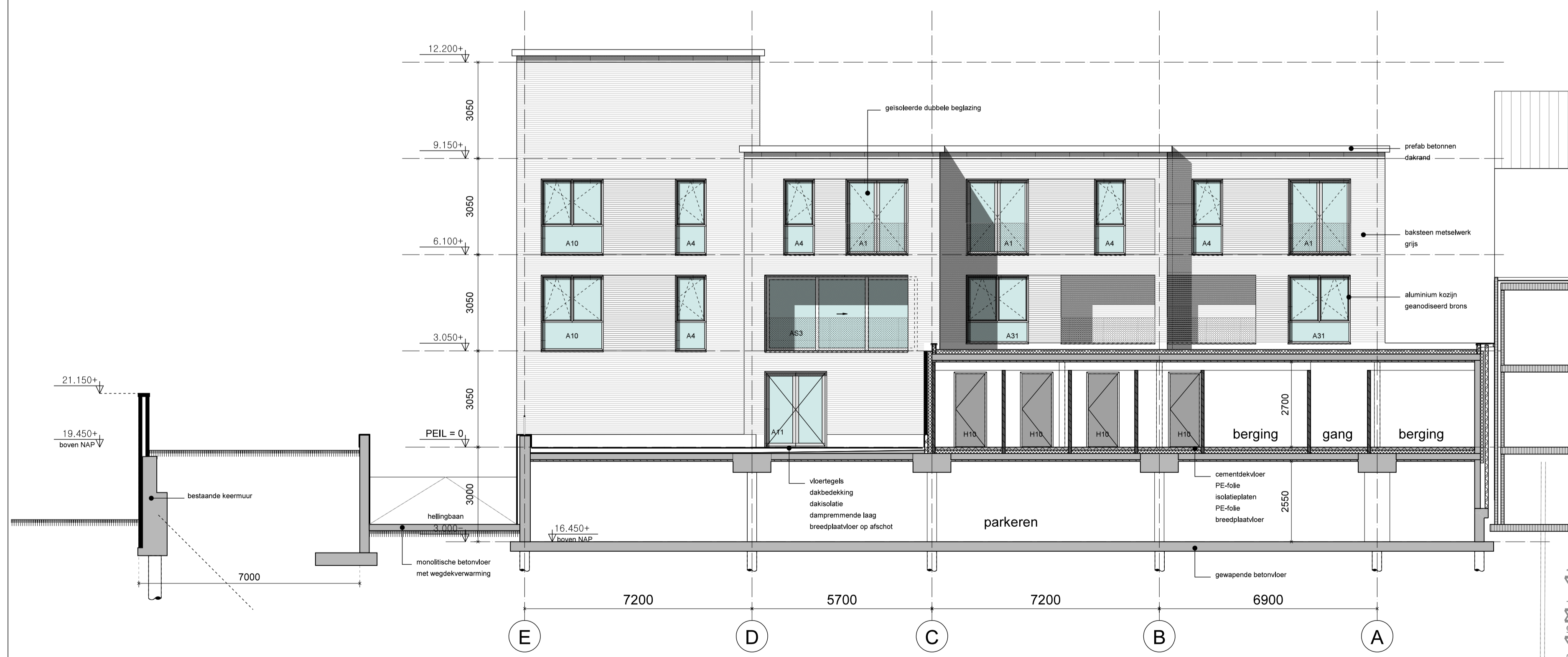
Zuid-Oostgevel en doorsnede F-F