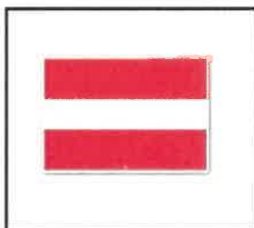
In-, uit- of doorvaart verboden (BPR, bijlage 7, A.1)