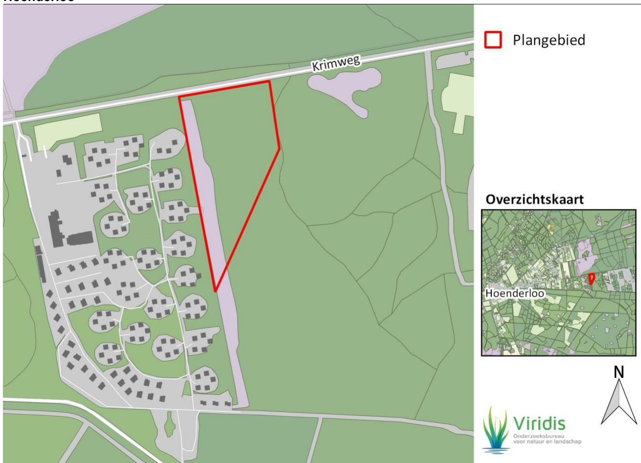
Figuur 1: Globale ligging van het plangebied aan de Krimweg 140 te Hoenderloo. Op het rood-omlijnde gebied van 3,5 hectare is de bouw van 80 nieuwe vakantiehuisjes gepland.