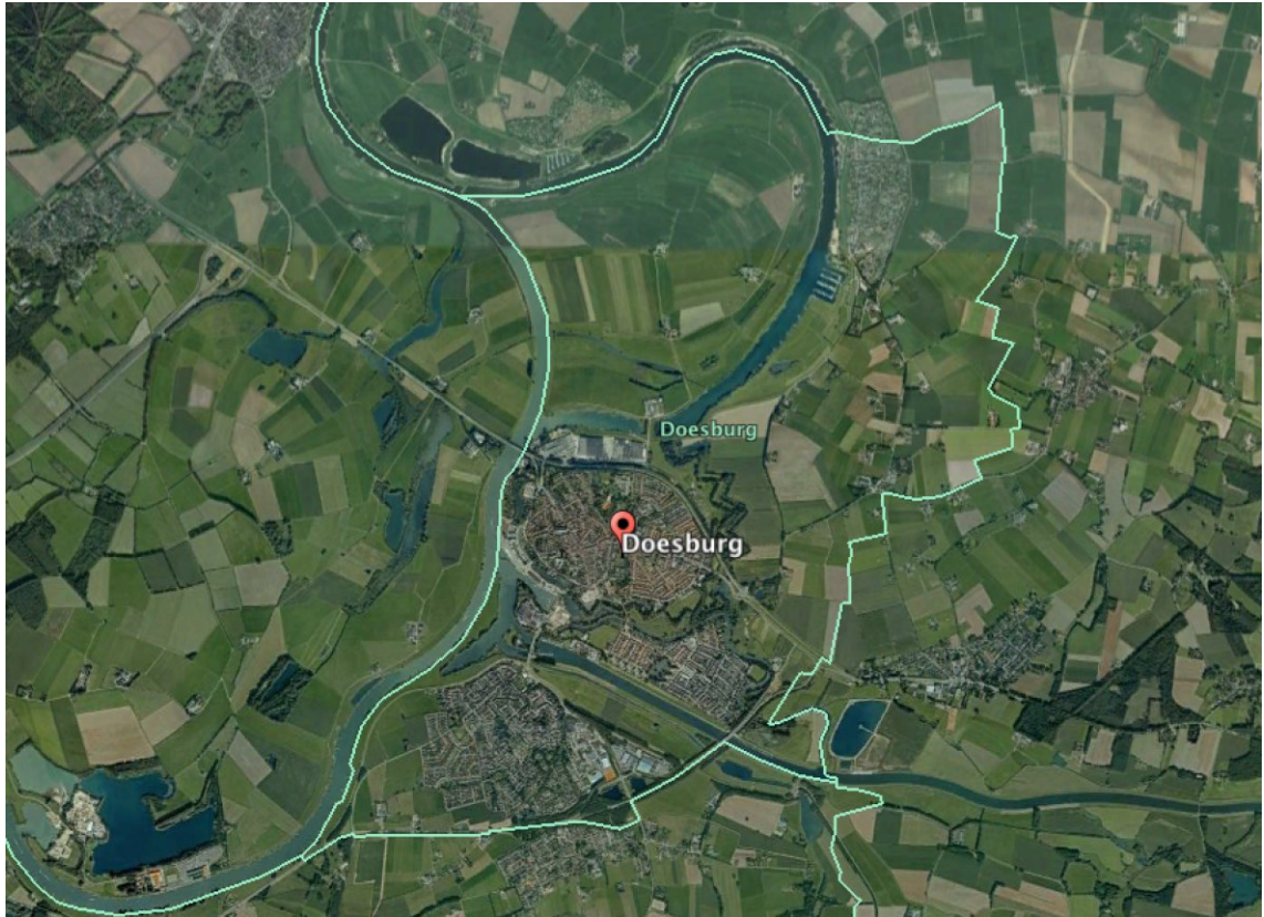
Kaart 1: gemeentegrens Doesburg (werkingsgebied ontheffing)