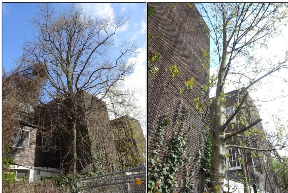
Afbeelding 2 & 3: Boomnummer 1 (links) en 2 (rechts).