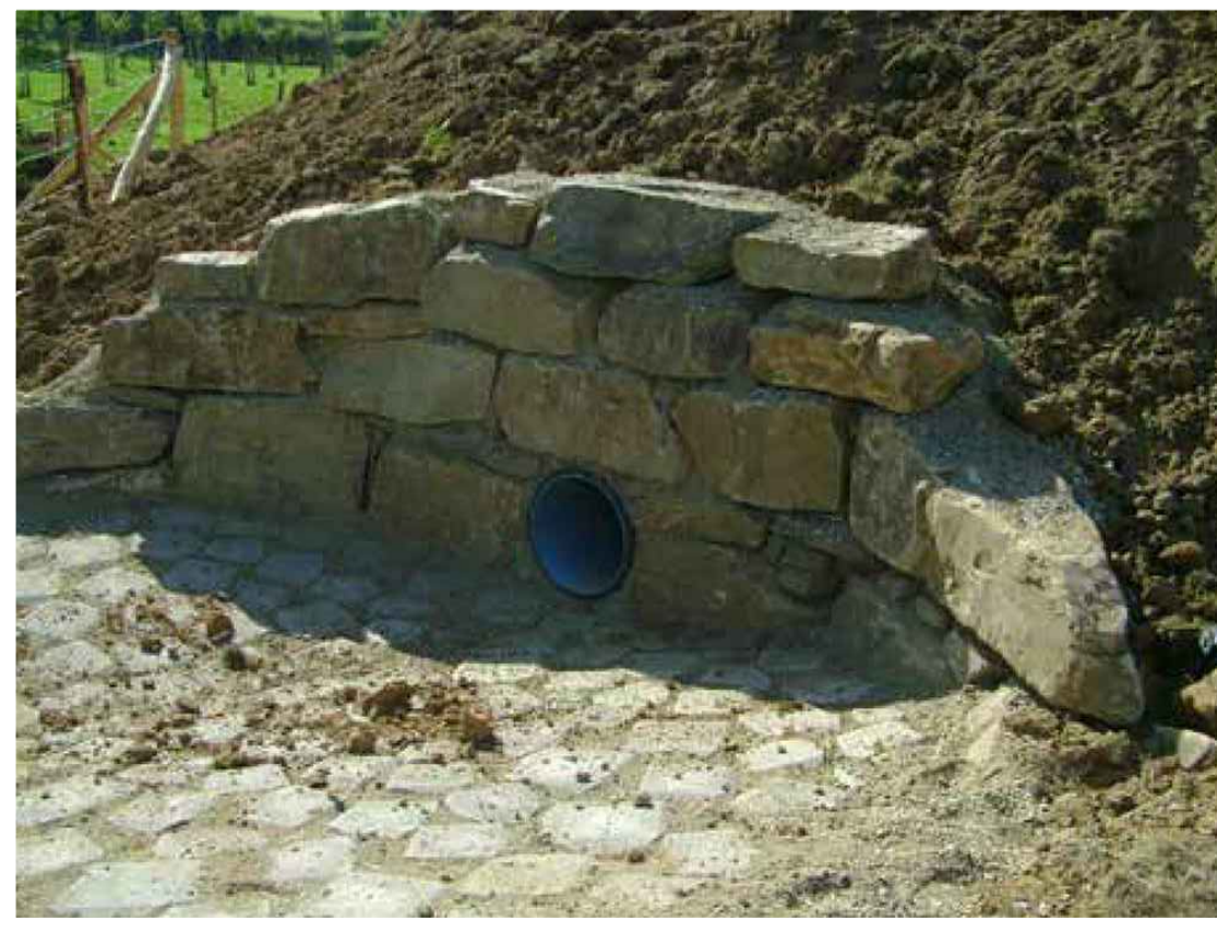
WENSBEELD FRONTMUREN STAPELSTEEN