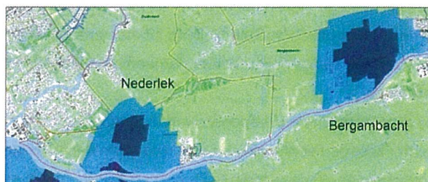
Figuur 2 – Milieubeschermingsgebieden voor grondwater

In deze gebieden zijn voor bepaalde geluidsintensieve activiteiten extra milieuvoorschriften van toepassing. Verder liggen in de Krimpenerwaard twee Milieubeschermingsgebieden voor grondwater (zie figuur 2). Hier wordt door Oasen grondwater gewonnen ten behoeve van de drinkwaterproductie. In