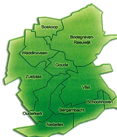
Figuur 1 - Regio Midden-Holland

zwaarder zijn. Omdat die bedrijven zijn gelegen naast een woonwijk, spelen veiligheid, geluid en geur een belangrijke rol bij het toezicht op die bedrijven. In de binnenstad bevinden zich vooral detailhandel en horecabedrijven.